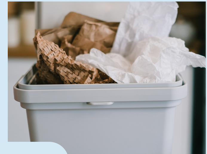
Papel e cartón

Realización de diferentes solucións co enfoque "faino ti mesmo" mediante os Polos Creativos (co seu material e metodoloxía) utilizando como materia prima materiais de refugallo tales como os cartón de embalaxe do propio Polo, envases baleiros, etc.